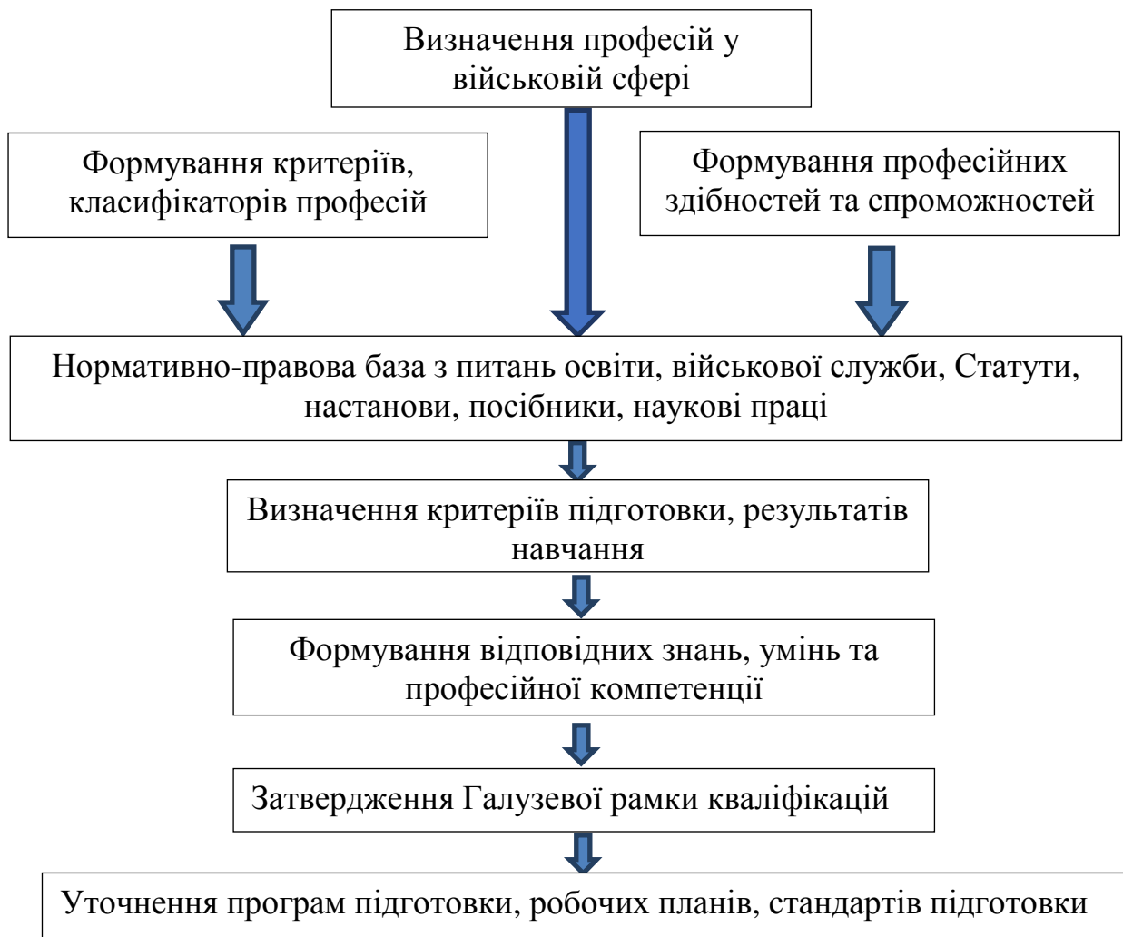
Рис. 2. Етапи формування галузевої рамки кваліфікацій

Після затвердження Галузевої рамки у разі необхідності до існуючих стандартів, навчальних планів, робочих програм вносяться відповідні зміни (рис.2).