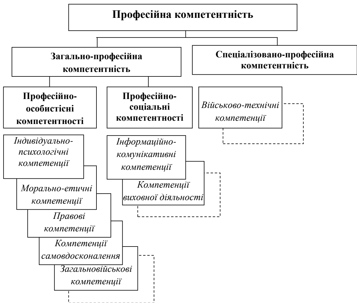
Рисунок 3. Варіативна структура професійної компетентності.

На підставі представленої узагальненої структури компетентнісної моделі офіцера-випускника ВВНЗ і ВВП ВНЗ; визначені загальні компетенції наповнені конкретним змістом; охоплюють основні функції майбутньої професійної діяльності [5]. Варіативна структура професійної компетентності в рамках нашого дослідження може мати такий вигляд (рис. 3):