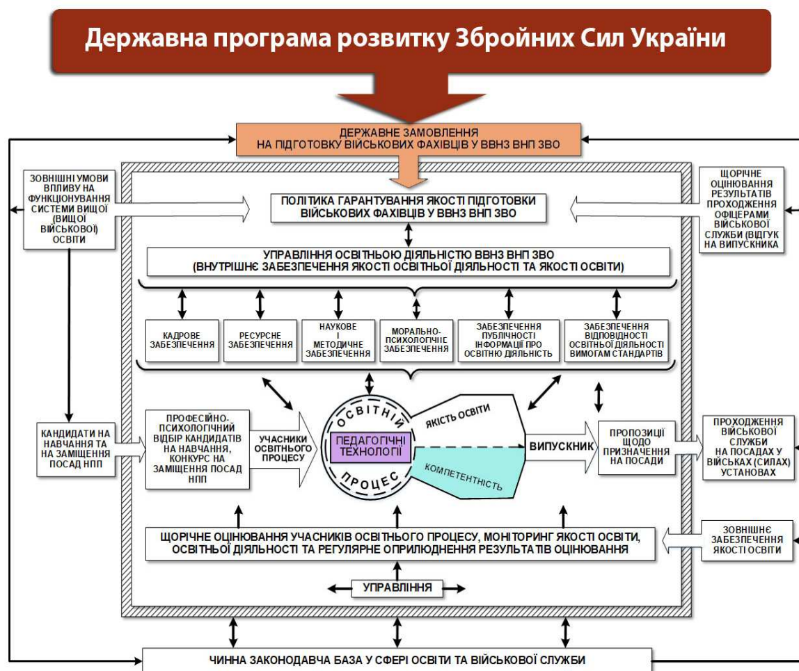
Рис. 2. Модель системи якості військової освіти

такі: забезпечення якості освітньої діяльності та якості освіти; політика гарантування якості підготовки військових фахівців; компетентність.