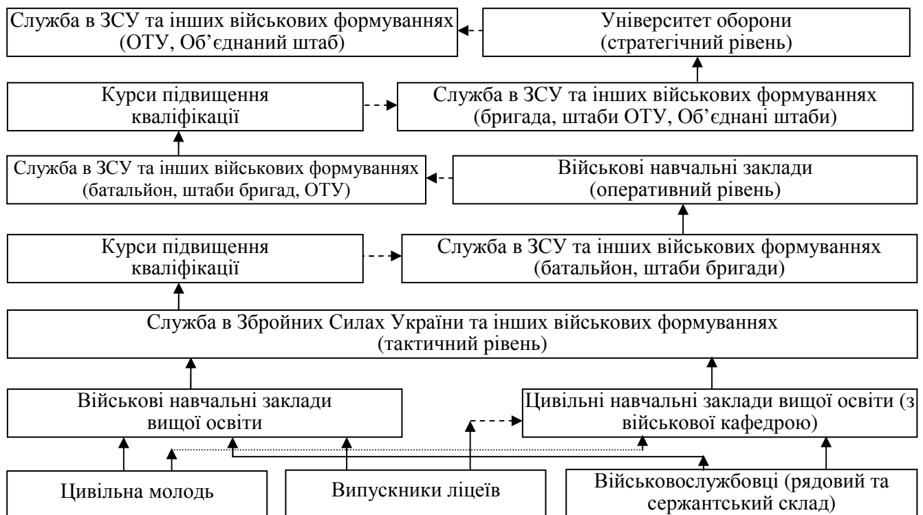
Рис 2. Система професійної підготовки офіцерів Збройних Сил України та інших військових формувань (Варіант)

На сьогодні з врахуванням досвіду країн НАТО реалізуються три рівні курсів: L-2, L-3, L-4. На L-2 буде вивчатись бригадна тематика, а на L-3 – виключно оперативна: навчання слухачів відбуватиметься в об'єднаних, змішаних групах без урахування спеціалізації, оскільки оперативний рівень передбачає ведення об'єднаних, міжвидових операцій і, відповідно, пов'язану з цим специфіку організації освітнього процесу. Відповідно, L-4 – це стратегічний рівень. Крім суто структурних змін, запроваджуються серйозні змістові зміни, якими передбачено розмежування між оперативним та стратегічним рівнями. Основу оперативного рівня становитимуть питання операційного планування та ведення всього спектру об'єднаних операцій, а стратегічного – основи оборонного менеджменту, оборонного планування та прийняття стратегічних рішень у безпековому секторі, діяльність Об'єднаних штабів.