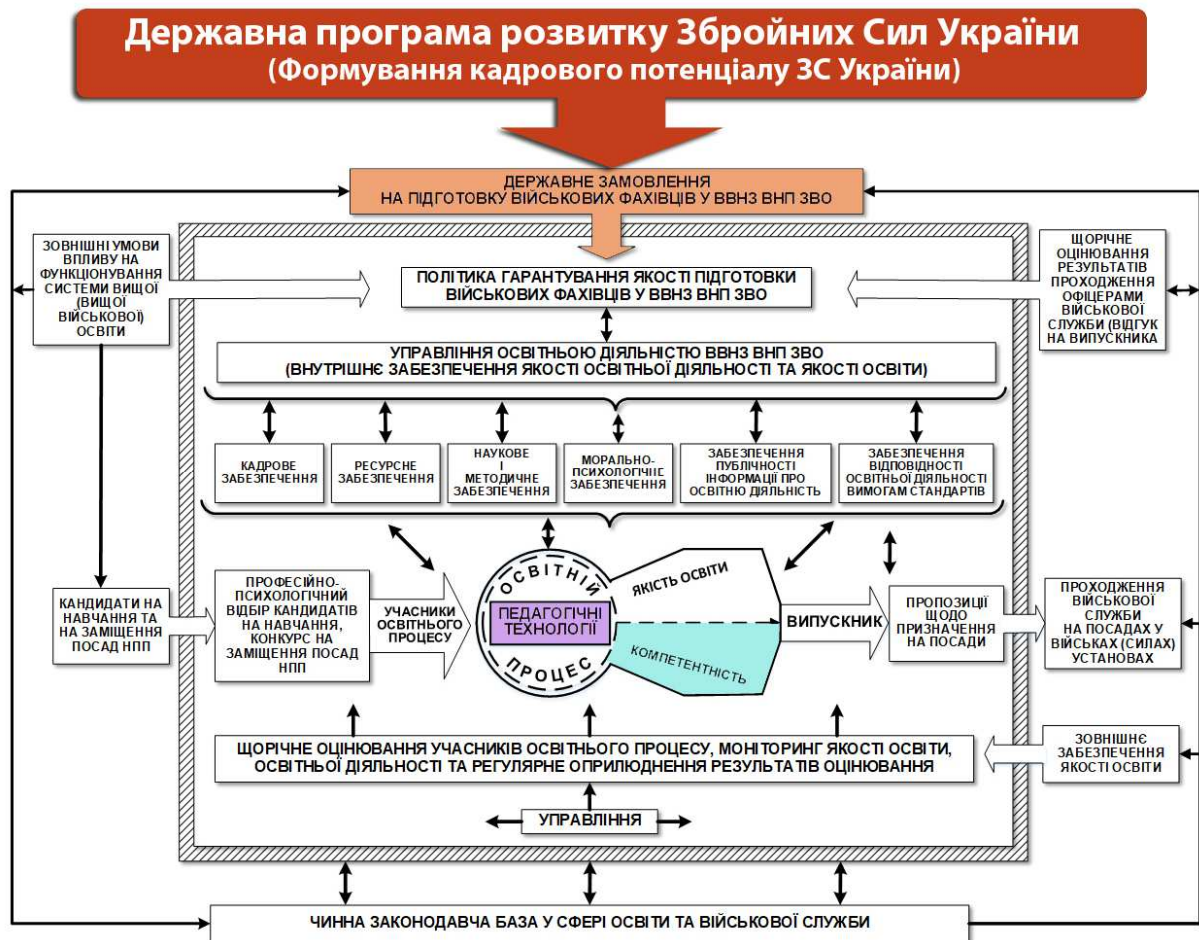
Рис. 1. Модель системи гарантування якості вищої військової освіти

Одні й ті самі складові педагогічного процесу в різних умовах (рис. 2), з різними суб'єктами можуть давати зовсім різні, а інколи й протилежні, наслідки.