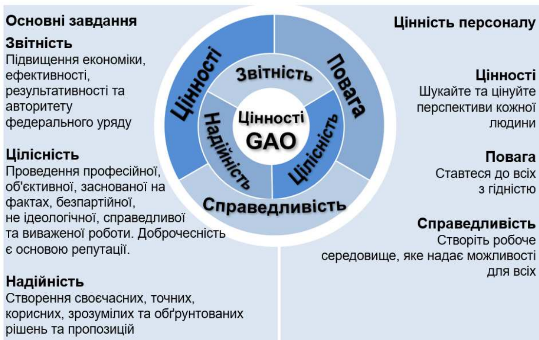
Рис. 1. Цінності у роботі GAO

[11]. Крім того, у своїй діяльності GAO керується такими цінностями як: звітність, цілісність, надійність, цінності, повага, справедливість (рис. 1) [7].