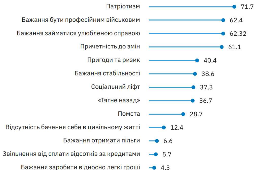
Рис. 3. Мотивація військовослужбовців (%)

В подальшому відслідковується тенденція зміни мотивації. Розглянемо квінтесенцію методики відслідковування тенденції зміни мотивації майбутнього офіцера.