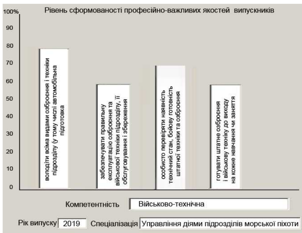
Рис. 3. Рівень сформованості професійно-важливих якостей випускників

Узагальнені дані щодо сформованості військово-професійних компетентностей та професійно-важливих якостей офіцерів-випускників ВВНЗ за кожною спеціальністю (спеціалізацією) їх підготовки, результати аналізу зазначених даних, а також пропозиції з удосконалення якості освіти та