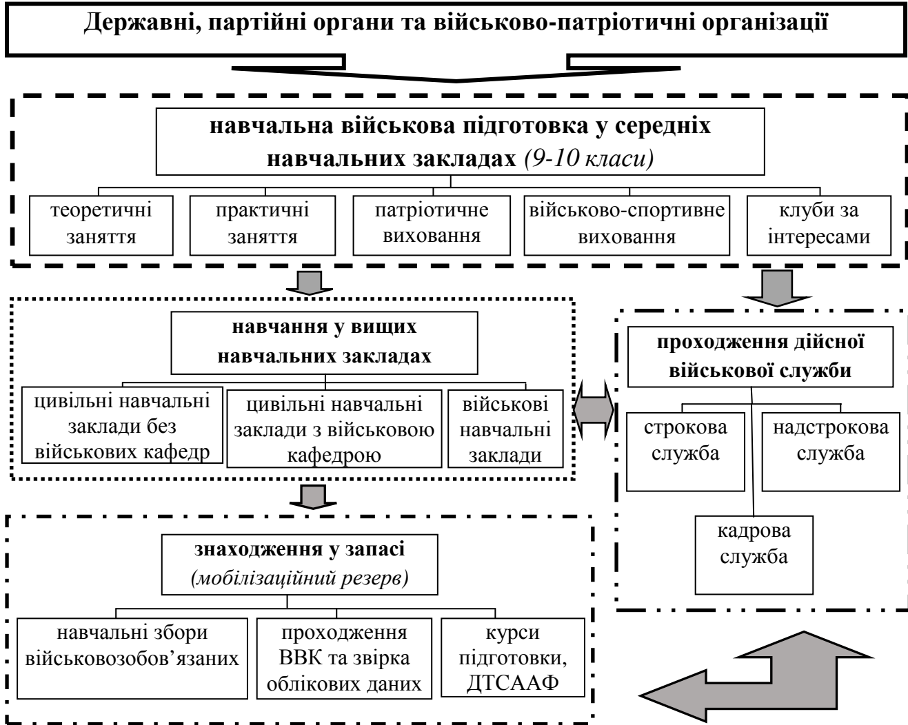
Рис. 1. Система військової підготовки громадян (радянський період)

Водночас «радянська» система військової підготовки та військово-патріотичного виховання мала недоліки, які негативно впливали на весь процес підготовки громадян. Так, проходження обов'язкової строкової служби чоловіками хоч і надавало багаточисельний резерв, однак цей резерв характеризувався дуже слабкою фаховою військовою підготовкою, яка згодом взагалі втрачалася через оновлення бойової техніки і озброєння. Підготовка сержантського та офіцерського складу протягом двох років не давала глибоких та професійних знань і навиків, а молоді спеціалісти в багатьох випадках проходили службу не за спеціальністю. Громіздкість системи та планування величезних заходів, брак коштів призводили до формального та поверхового проведення навчальних зборів із військовозобов'язаними. У вищих цивільних навчальних закладах питаннями військової підготовки переймалися поверхово, що також негативно впливало на якість мобілізованого резерву. Контроль за порядком та якістю проходження військово-лікарської комісії військовозобов'язаними з боку посадовців військкоматів, які відповідали за цю ділянку роботи, назагал був формальним.