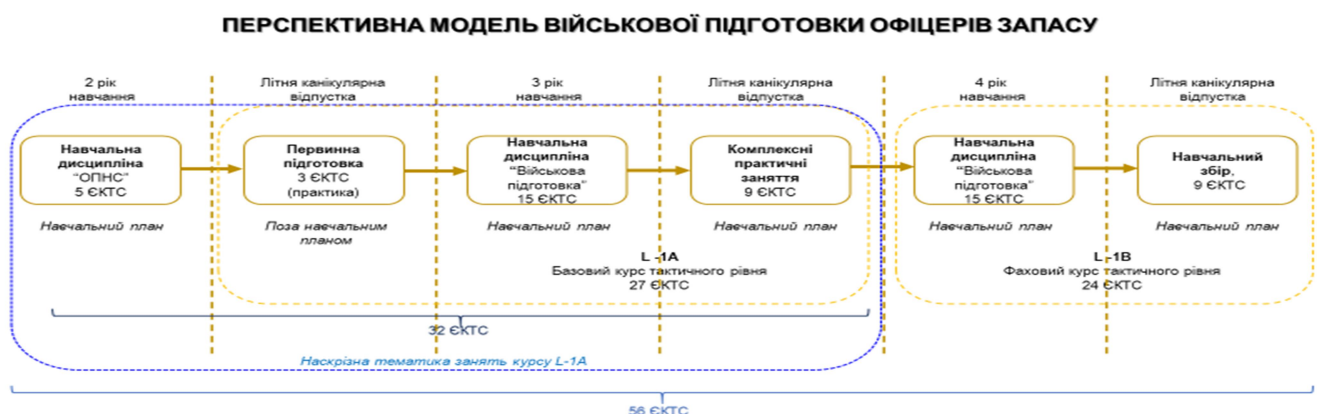
Рис.1. Перспективна модель військової підготовки офіцерів запасу.

Таким чином, за результатами проведеного аналізу, на рисунку 1 пропонується варіант перспективної моделі військової підготовки офіцерів запасу. Алгоритм залучення офіцерів запасу до військової служби наданий на рисунку 2.